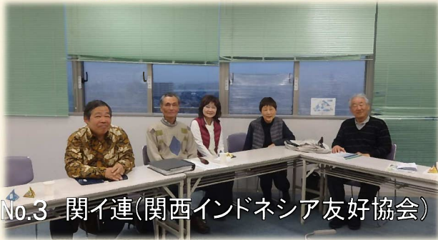
No.3 関イ連(関西インドネシア友好協会)