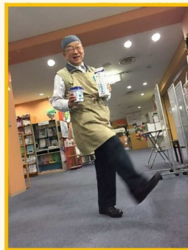
日本語交流活動ボランティア

ここでは日本語ボランティアとしての関わりだけでなく、センターに集う人たちと多様な関わり方ができることが嬉しいですね。自分の立場からできる限り応えたいと思っています。