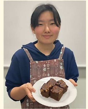
子ども学習広場 学楽多

普段から、予想外のことが起きるとへこんだり怒っちゃうこともあるんです。でも、「これはこれでいいんだ」「まあいっか」って少しずつ思えるようになってきたので、自分でも変化も感じます。