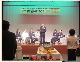
各国領事から のご挨拶