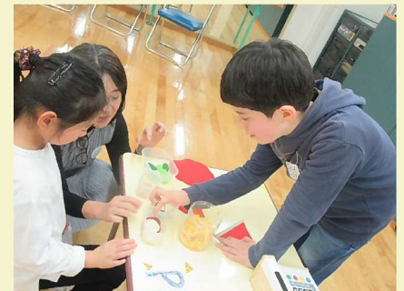
お買い物ゲームの様子です。講師の手作り教材を使って英語でお買物を楽しんでいました！