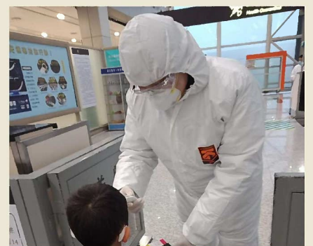
中国国内の空港では、防護服を着た人が検温を行います。

今、中国全土で、感染拡大防止のために厳重な管理が行われています。皆それぞれ窮屈な思いをしながら、徹底的に感染防止策に従い、ウイルスの終息を心から待ちわびている状況です。どうか、感染してしまった方々が快復に向かい、一刻も早く静かな日常が戻ってきますように……。と祈るばかりです。中国加油(がんばれ)！！