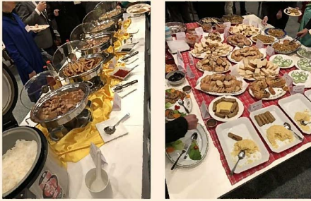
世界の料理を味わいました！

今年で4回目になるこの集いは、当会の活動についての理解を深めると共に、参加者同士の交流を深めるために開催しています。