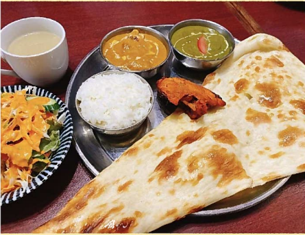
ランチCセット。これにドリンクが付いて1150円！！

「最近気になるエスニック料理店増えてるよね…？どんなお店なんだろう…？」という話からはじまった不定期連載企画。気になるお店に行ってみよう！ということで、豊中近辺のエスニック料理店で働いている方に直接お話を伺いました。第一回は豊中市役所向かいにあるインド・ネパール料理店、タージマハルエベレスト。コックとして働くカandelさんにお話を伺いました（写真左）。