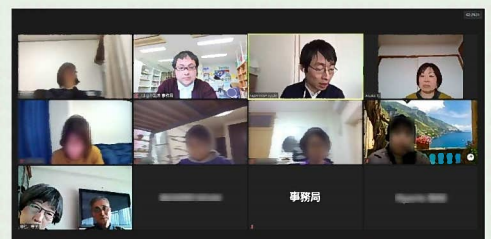
メディアリテラシー講座としては初のオンライン開催でした!