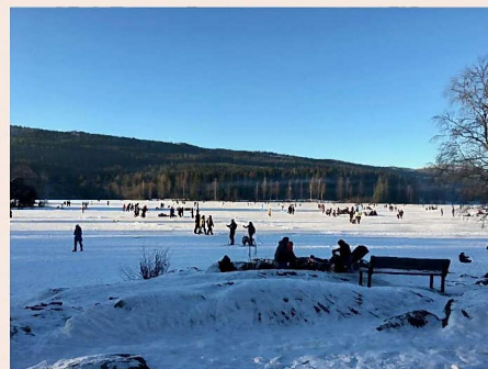
冬のオスロ、凍った湖の上で ピクニックやスケートをする人たち