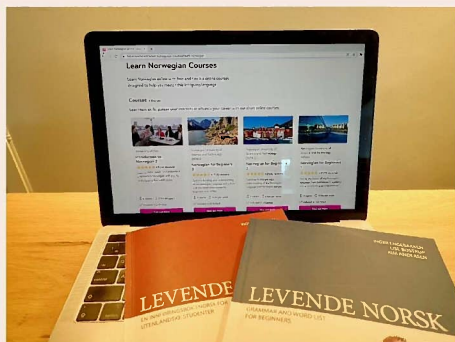
大学が提供する無料でノルウェー語が 学べるウェブサイト