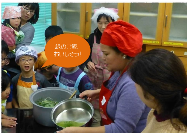
ペルーのクリスマスの回ではお料理も体験!

小・中学生のための国際理解プログラム。地域に住む外国人を講師に迎えて交流しながら、様々な国、地域について学びます。月1回程度実施。