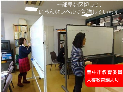
一部屋を区切って、いろいろなレベルで勉強しています。