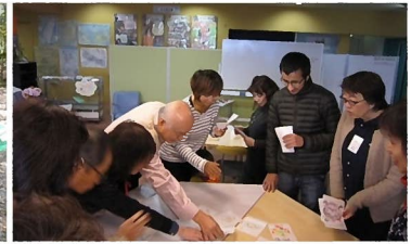
正月ゲーム「かるたとり」