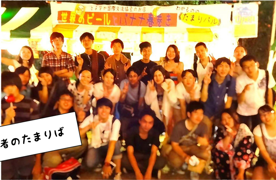
写真右上)「たまりば@寺子屋」と題した勉強会にて、奨学金についてのお話を聴いているところ。 写真上) 豊中まつりでは世界のビールや料理を出店。屋台の前でみんなでバシャリ! お疲れ様~

外国にルーツをもつ若者のための居場所づくりや表現活動をさまざまな角度から行っています。(文化庁委託事業) 15歳以上の外国にルーツをもつ若者が中心となり、国際交流センターはもちろん、地域で色々な活動に取り組んできました。