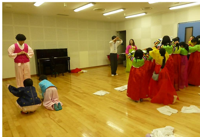
韓国・朝鮮の文化を学ぶ「チョアチョアハングル」は年5回開催