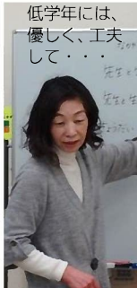
低学年には、優しく、工夫して・・・