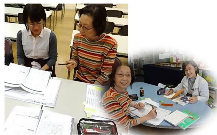
協会の日本語ボランティア有志で結成された「日本語支援グループ・むすびめ」との共催で日本語能力試験を受験する人のための個別サポートを実施して、就労やキャリアアップをめざす方をサポートしています。