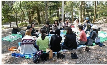
野外活動「花見と野点」

いろいろな目的や目標を持って教室に来る日本語学習者の期待に対応できるように、私達ボランティアもより一層のスキルアップに努めたいと思います。また学習者が日本での生活に何を必要としているかを一緒に考えて、自由に交流・情報交換ができる機会を増やしていきたいと考えています。