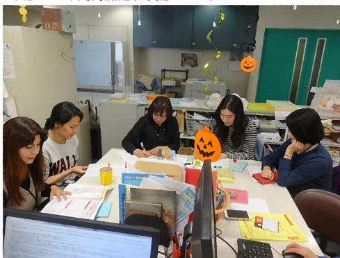
多言語スタッフは全員女性です。