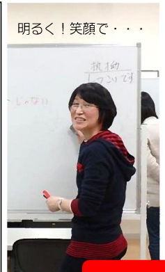
明るく！笑顔で・・・

外国人を前にして、言いたいことがあるのに言えない、何を言っているかよくわからなくて、もどかしい思いをしたことはありませんか。親と一緒に日本にやってきた子どもたちは、周りがそんな外国人ばかりの中に、いきなり入って来るのです。私たちは、そのような子どもたちが、少しでも早く、友達関係や勉強が充分にできるように、日本語を教えています。現在、豊中のいろいろな小中学校から、いろいろなレベルの子どもたちが集まって、日本語の勉強をしています。