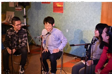
写真右上) 会場は入り口近くまで人があふれて大盛況！ 写真右下) グランドファイナルでは参加者全員でマカレナを踊りました！ 写真左) ラジオの公開録音ではMCがゲストを招き、軽快なトークを展開。