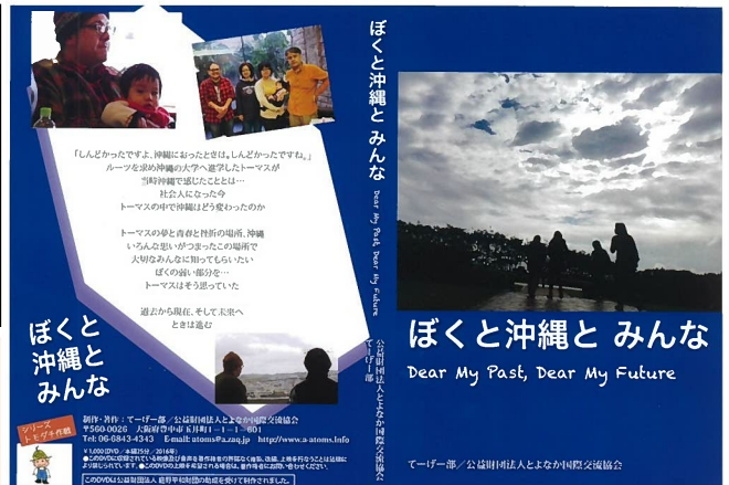
ぼくと 沖縄と みんな

次回作に向けて、新しい表現のかたちを探っていきます。またできた作品の上映などを通して、より多くの人たちとの交流、つながりづくりの機会をつくっていききたいと思います。