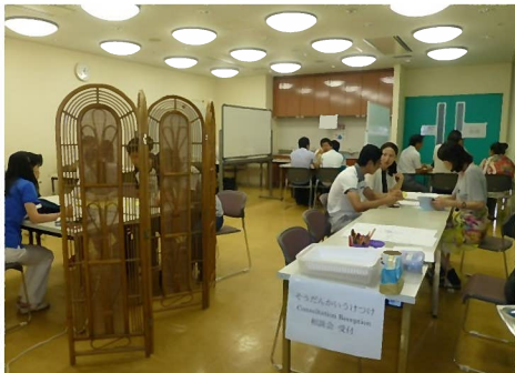
一日法律・労働相談会のようす。(公財)大阪府国際交流財団との共催。大阪府行政書士会豊能支部や NPO 法人チャームとの共催での一日専門相談会も実施しました。