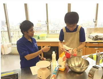
写真右上) 新作DVD「ぼくと沖縄と みんな」 写真右下) 多文化フェスティバルで新作DVDの披露 写真左) とよなか国際交流フェスタで販売するちんすこうの仕込みの様子