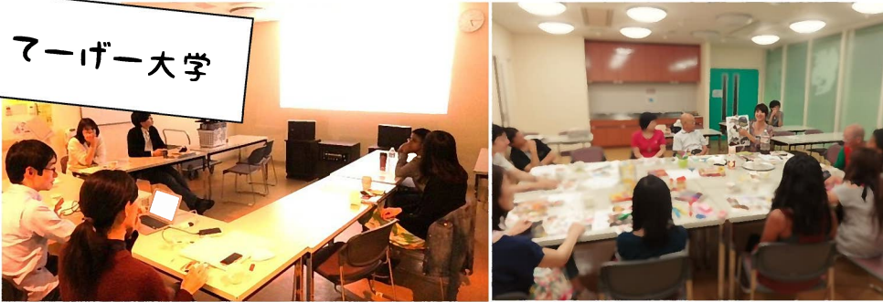
写真左) てーげー大学では、毎回講師が「好きだけど普段あまり共有しないこと」を発表。写真は「プログレ逃避論」 写真右) おしゃれをテーマにした回