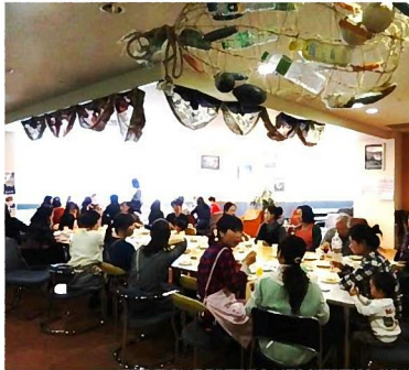
中国人女性コミュニティの交流会。ママたちがたくさん集って、にぎやかです。