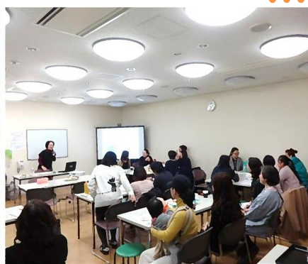
外国人女性向けセミナー「もっと幸せになるための夫婦間コミュニケーション講座」&無料健康相談会