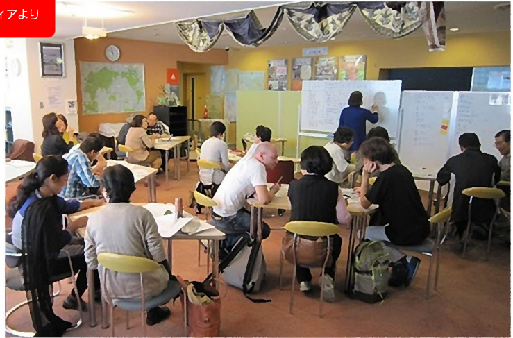
学習風景「だれといつどこで」

もっともっと日本語を話せるようになりたい、日本で仕事をしたい、資格を取りたいなどの確かな目標を持った外国人のための学習グループです。グループの大きな特徴である全体学習とマンツーマンサポート混在形式の中に、全員の前で発表体験を取り入れたスタイルがうまく定着し機能した一年だと感じています。以前に学習していた人が仕事の合間に元気な顔を見せてくれたり、また学習のなかで自分の国の文化や習慣などを一生懸命に説明してくれる姿を見ると、彼らにとっての大切な“居場所”を提供できていると実感できました。