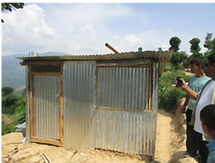
竹と亜鉛板でできた仮設住宅