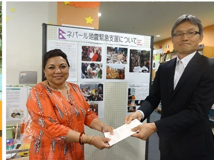
来阪した FEDO 代表に、協会理事長より募金を手渡し