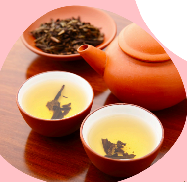
ちゅうごくちゃ 中国茶