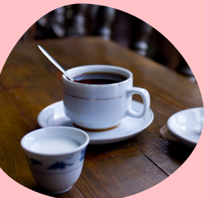
うんなん 雲南コーヒー